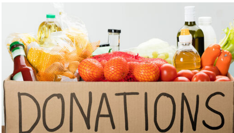
<alt> Un carton rempli de produit alimentaire qui vont être donné </alt>

Au niveau alimentaire, le gouvernement a mis en place des activités de distribution alimentaire avec les collectivités locales, mais aussi des dons et des collecte de denrées alimentaires apporter aux associations par des restaurateurs, industriels, cuisines centrales d'après France stratégie .