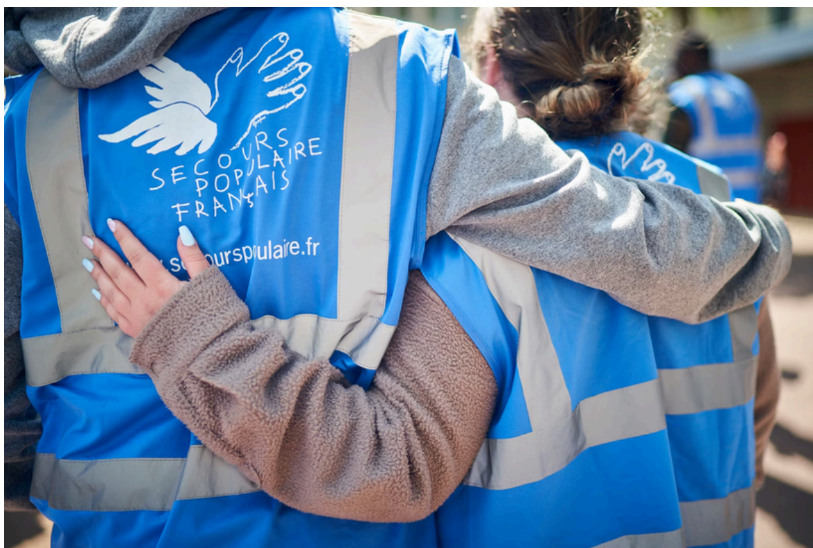
<alt> Deux adhérents de l'association du Secours populaire qui sont solidaires </alt>

L'aide alimentaire qu'a pu apporter le Secours populaire a permis aux personnes de reporter leurs efforts sur le paiement de leurs loyers, afin de repousser la possibilité de l'expulsion et le cauchemar de la rue. Étant donné que de nombreux Français en situation précaire ont déjà envisagé une situation de pauvreté.